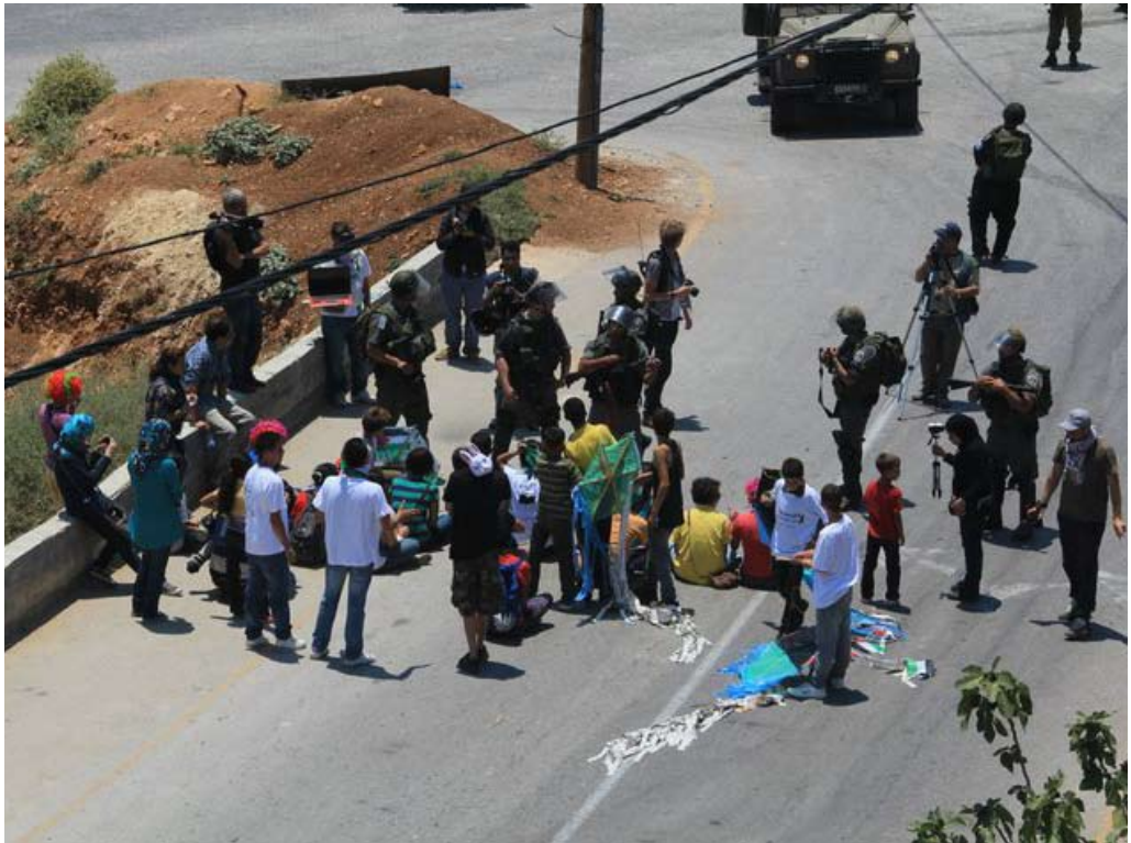
ילדי א-נבי סאלח בתהלוכת תחפושות ועפיפונים, 24.6.11.

העובדה שצו כזה נחתם מדי שבוע, עוד בטרם החלה ההפגנה, מעלה את החשד כי המניע להוצאת הצו אינו צורך ביטחוני כי אם הרצון למנוע את עצם קיומן של ההפגנות. בחלק מהמקרים הרחיקו כוחות הביטחון מהכפר אזרחים ישראלים וזרים בטענה שהם מפירים את הצו, גם בלי שנקטו אלימות. כך אירע, למשל, במהלך שתי הפגנות שהתקיימו ב-22.7.11 וב-29.7.11, כאשר חיילים עברו בין הבתים והורו לפעילים ששהו בהם לעזוב את הכפר.