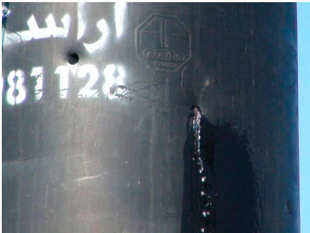
דוד מים מנוקב לאחר שנפגע מרימון גז. 24.6.11

על פי העמדה הרשמית של הצבא אין לירות רימוני גז בכינון ישיר לעבר אדם. 19 בפגישה עם בצלם טען מפקד אוגדת איו"ש, תא"ל ניצן אלון, כי האיסור אינו נוגע לזווית הירי, אלא חל על כיוון רימוני גז לעבר אדם – אם בכינון ישיר ואם בכינון עקיף. לתפיסתו, ירי בכינון ישיר מותר כל עוד אין סכנה לפגיעה באדם. 20