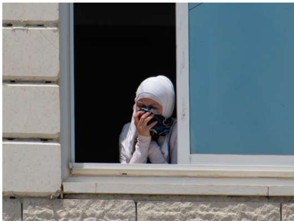
הגז המדמיע חודר לבתים. צילום: נועם פרייס, בצלם, 8.7.11

סגירת הכבישים באזור והצבת המחסומים מיועדות אמנם למנוע הגעת משתתפים להפגנה שבכפר, אך פוגעות באופן ישיר ב-12,000 תושבים הגרים בחמישה כפרים באזור, בהם הכפר א-נבי סאלח, ובכל האנשים המבקשים להגיע אליהם. הדרך המובילה לקראוות בני זייד, למשל, היא דרך מרכזית המחברת בין מערב רמאללה ומחוז סלפית. חסימת הדרך מדי שבוע מגבילה את תנועתם של פלסטינים רבים ופוגעת בשגרת חייהם.