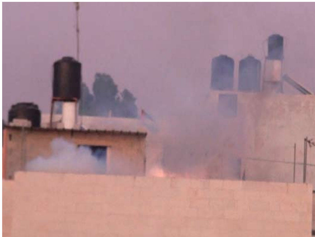
בית בא-נבי סאלח אפוף גז מדמיע, 15.7.11.

עמדת בצלם היא כי אין לירות כלל רימוני גז ממטול בכינון ישיר, במיוחד בקרב אוכלוסייה אזרחית, מכיוון שמדובר בנשק לא מדויק, שסטייה קלה ממסלולו עלולה לגרום לפגיעה באדם. מהתצפיות שערך בצלם עולה כי כוחות הביטחון יורים לעתים קרובות רימוני גז בכינון ישיר, ובהפגנה שנערכה ב-13.5.11 נפצעו מירי כזה שני מפגינים. 21 [לצפייה בקטע וידיאו להמחשה: http://www.youtube.com/watch?v=0zSmhA96clw&feature=youtu.be ].