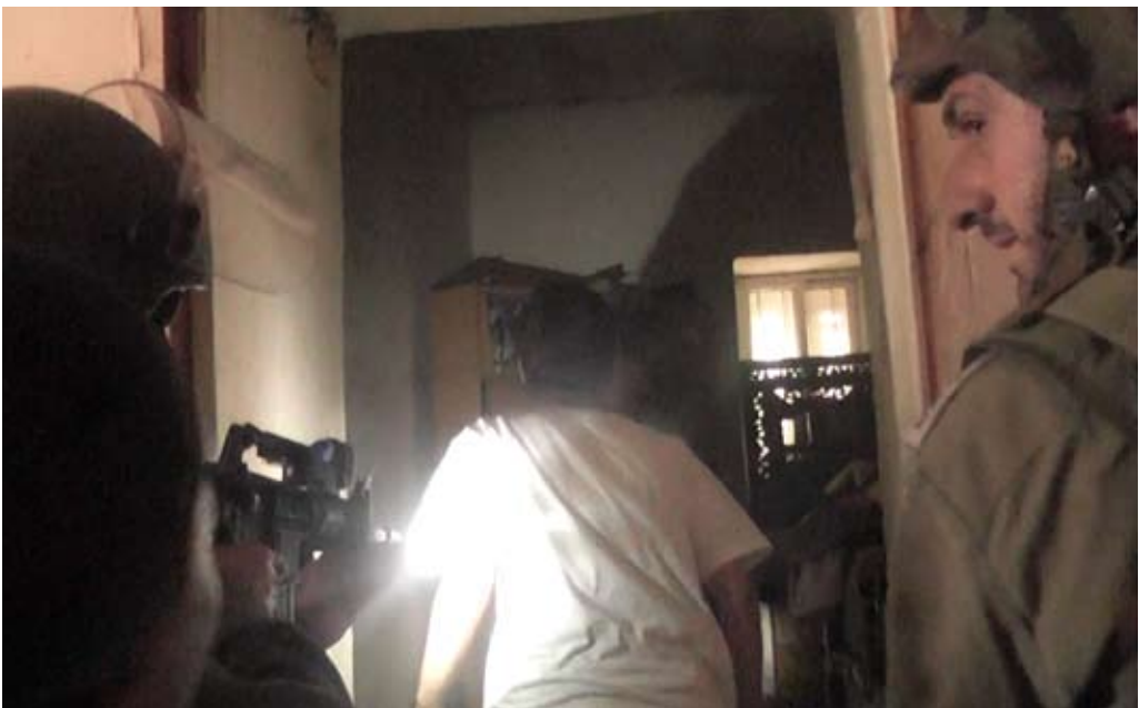
חיילים פורצים לתוך בתים, 22.7.11.

ב-22.7.11 עברו חיילים בין הבתים וחיפשו אזרחים ישראלים וזרים במטרה להרחיקם מהכפר וכן עצרו חמישה פלסטינים. באחד ממבצעי המעצר התפרצו חיילים לבית, אחד מהם שלף אקדח וכיוון אותו לעבר יושבי הבית. החיילים עצרו את אחד התושבים ועזבו את המקום. [לצפייה בקטע וידאו להמחשה : http://www.youtube.com/watch?v=q21IUVLXW :4&feature=youtu.be]