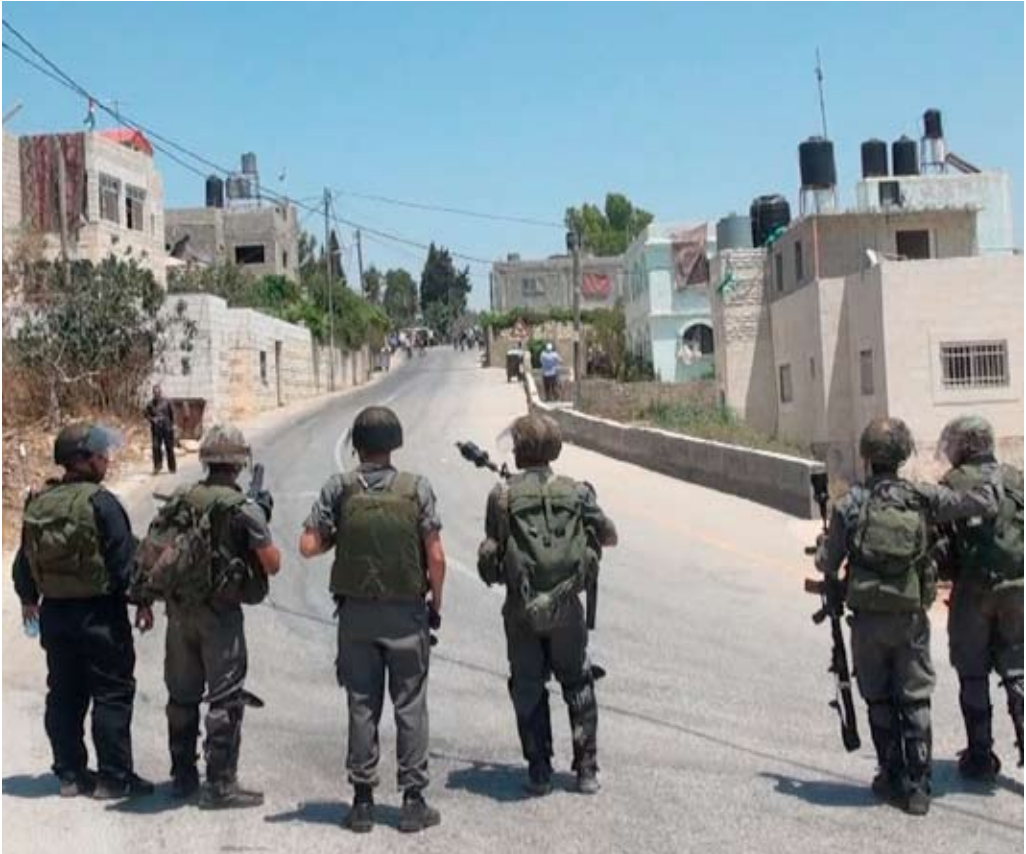
חיילים ממתנינים כדי לפזר את התהלוכה, 15.7.11.