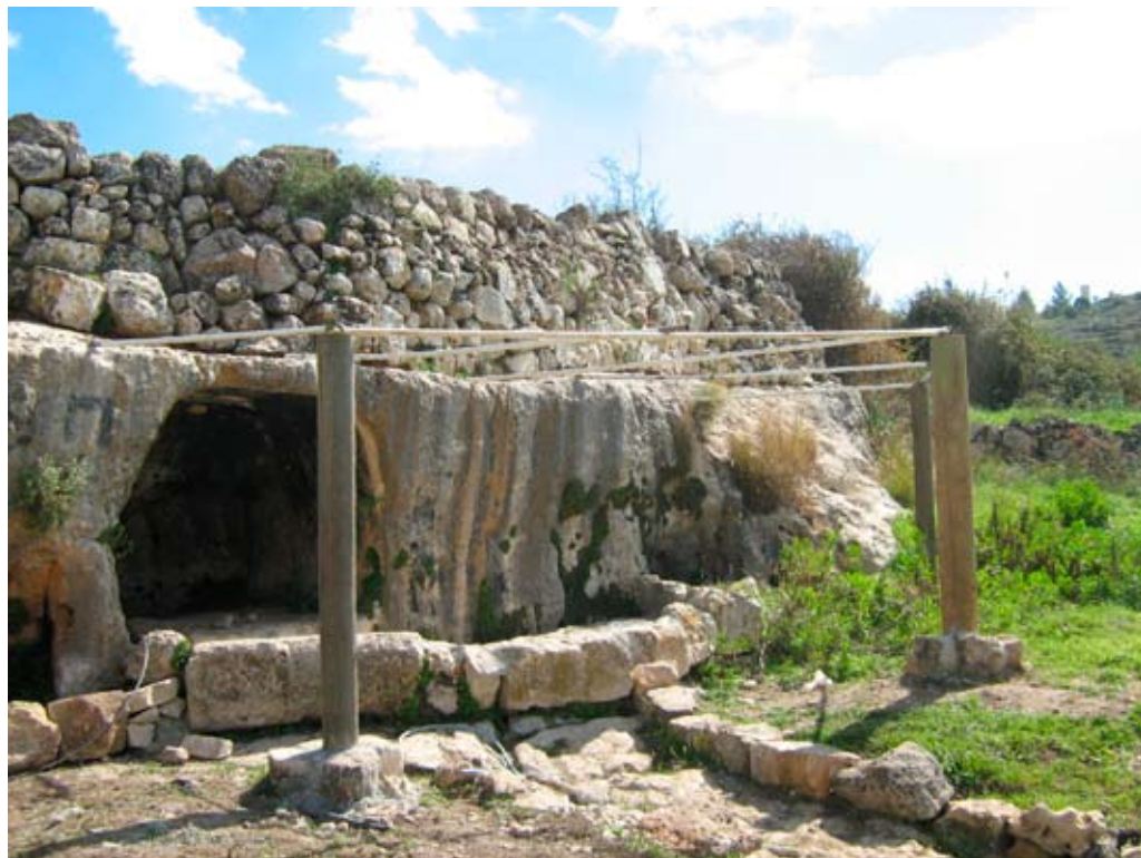
תחילת עבודות הבנייה במעיין אל-קוס. צילום: איאד חדאד, בצלם, 16.2.09

בתחילת ינואר 2010 טענו הרשויות בפני התושבים כי המעיין הוא אתר ארכיאולוגי, וגישתם של פלסטינים אליו נאסרה. ב-13.1.10 הוציא קצין המטה לארכיאולוגיה במנהל האזרחי צו המורה על הפסקת עבודות הבנייה, בטענה שבמקום נערך סקר ארכיאולוגי. ב-16.12.10 עתרו בעל הקרקע ונציגי תושבי הכפרים דיר ניט'אם וא-נבי סאלח לבג"ץ, באמצעות ארגון "יש דין", בטענה כי האתר לא הוכרז מעולם באופן רשמי כאתר ארכיאולוגי, ולכן האיסור על הגישה למקום נעשה בחוסר סמכות. 4 ארבעה ימים לאחר הגשת העתירה הוכרז המעיין באופן רשמי כאתר ארכיאולוגי, ותוך פחות משבוע אושרה ההכרזה על ידי ראש המנהל האזרחי. בעקבות זאת, מחקו העותרים את עתירתם.