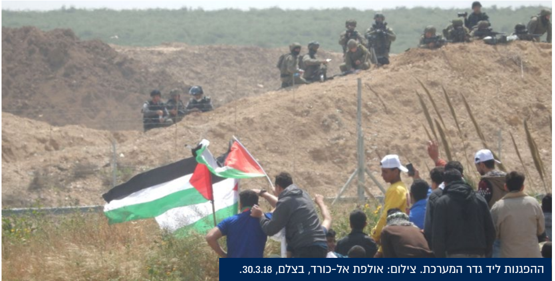
ההפגנות ליד גדר המערכת. צילום: אולפנת אל-כורד, בצלם, 30.3.18.

הוראות הפתיחה באש לא הוצגו בפני השופטים. הטענה הרשמית הייתה שהעותרים סירבו שהמדינה תציג לשופטים את ההוראות במעמד צד אחד. ואולם העותרים הבהירו כבר במהלך הדיון כי סירובם מתייחס אך ורק לתהליך המודיעיני, שהמדינה התעקשה להעביר לשופטים במקביל להוראות, בעוד לא הייתה להם כל התנגדות לכך שהשופטים יעינו בהוראות עצמן.