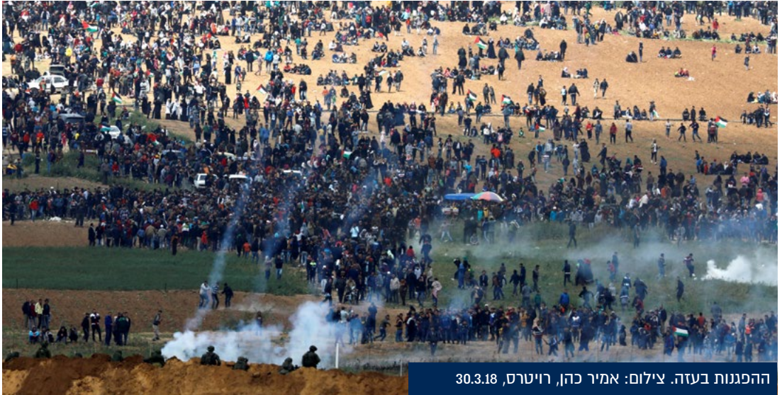
ההפגנות בעזה. צילום: אמיר כהן, רויטרס, 30.3.18

נוסף על כך, הפצ"ר, שהופקד על ניהול החקירות, נמצא בניגוד עניינים בכל הנוגע לחקירת מדיניות הפתיחה באש בהפגנות: מצד אחד, הוא האחראי על מתן הייעוץ המשפטי לצבא לפני האירועים ובמהלכם ובמסגרת זו הוא פועל בשיתוף פעולה הדוק עם הדרגים המבצעיים בשטח, לכל אורך הלחימה, ומאשר בזמן אמת את יישום המדיניות. מצד שני, הפצ"ר הוא זה שנדרש להכריע באלו מקרים תיפתח חקירה ומה יהיו הצעדים שיינקטו בסיומה. במקרים שבהם החשד נוגע להוראות שהוא ניסח ולפעולות שהוא אישר – יאלץ הפצ"ר להורות על חקירה נגד עצמו ונגד הכופים לו. לפיכך, הפקדת החקירה בידי מובילה לכך שהמדיניות עצמה כלל לא תיחקר.