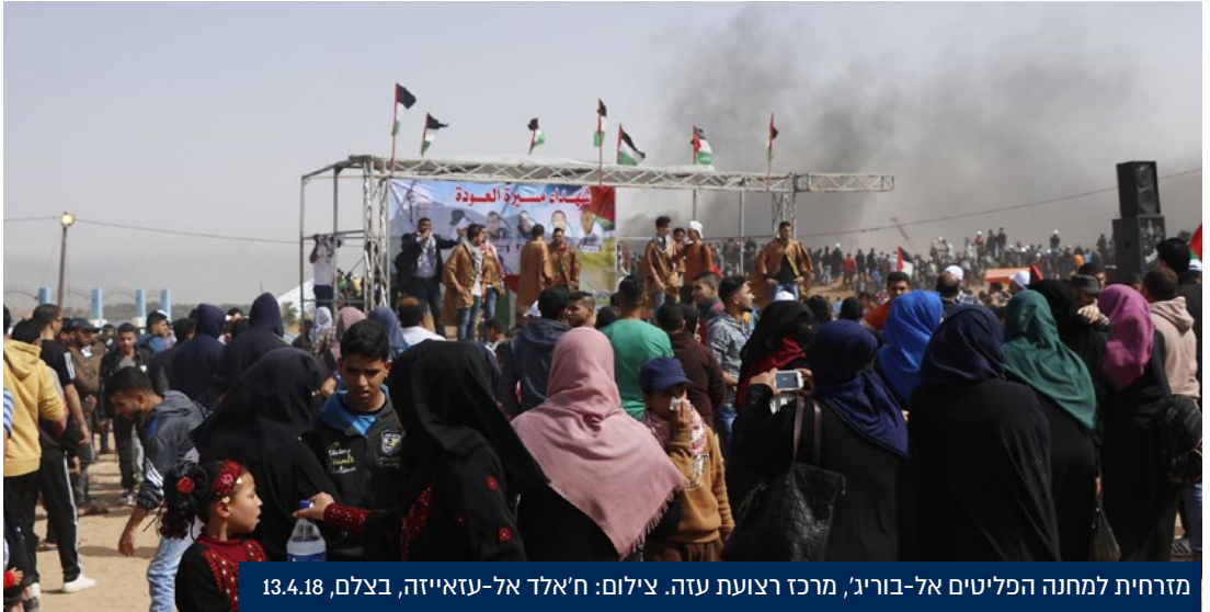
מזרחית למחנה הפליטים אל-בוריג', מרכז רצועת עזה. צילום: ח'אלד אל-עזאייזה, בצלם, 13.4.18

להכריע בשאלה האם יש לפתוח בחקירה פלילית, אלא רק לקיים "בירור עובדתי מקיף של האירועים ואיסוף נתונים וחומרים רלוונטיים" כדי לספק לפצ"ר "מידע עובדתי מלא ככל הניתן הנדרש לקבלת הכרעה בשאלה אם קיים חשד סביר לביצוע העבירה הפלילית, המצדיק פתיחה בחקירה". 15