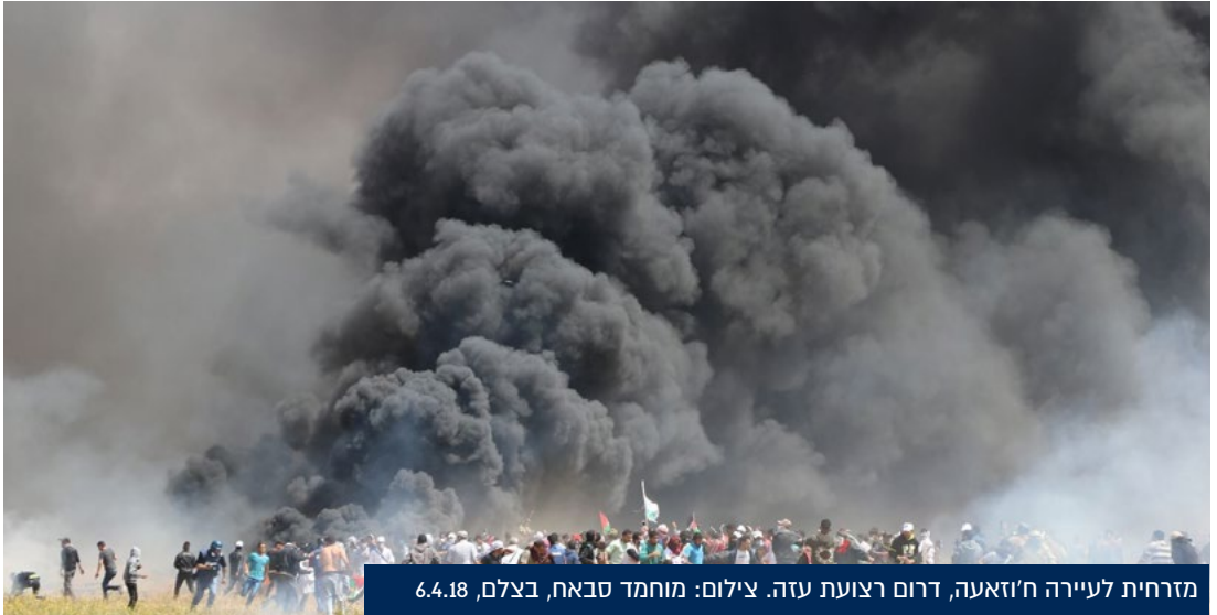
מזרחית לעיירה ח'זאעה, דרום רצועת עזה. צילום: מוחמד סבאח, בצלם, 6.4.18

המאשרת כי לבית הדין נתונה סמכות ברצועת עזה ובגדה המערבית (כולל במזרח ירושלים). כחודש לאחר מכן, ב-3.3.21, הודיעה התובעת כי היא פותחת בחקירה.