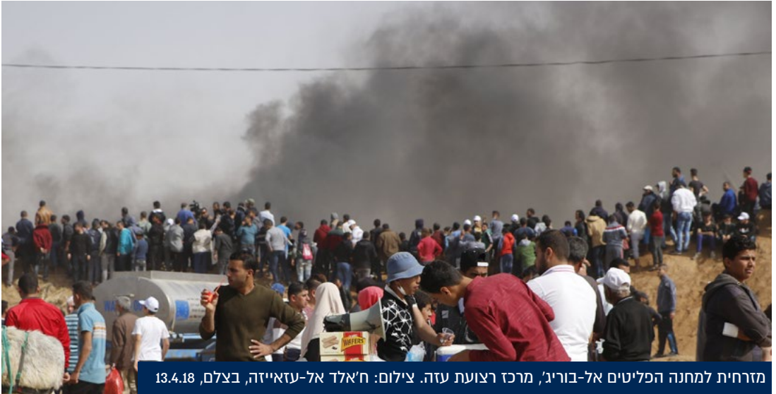
מזרחית למחנה הפליטים אל-בוריג', מרכז רצועת עזה. 13.4.18