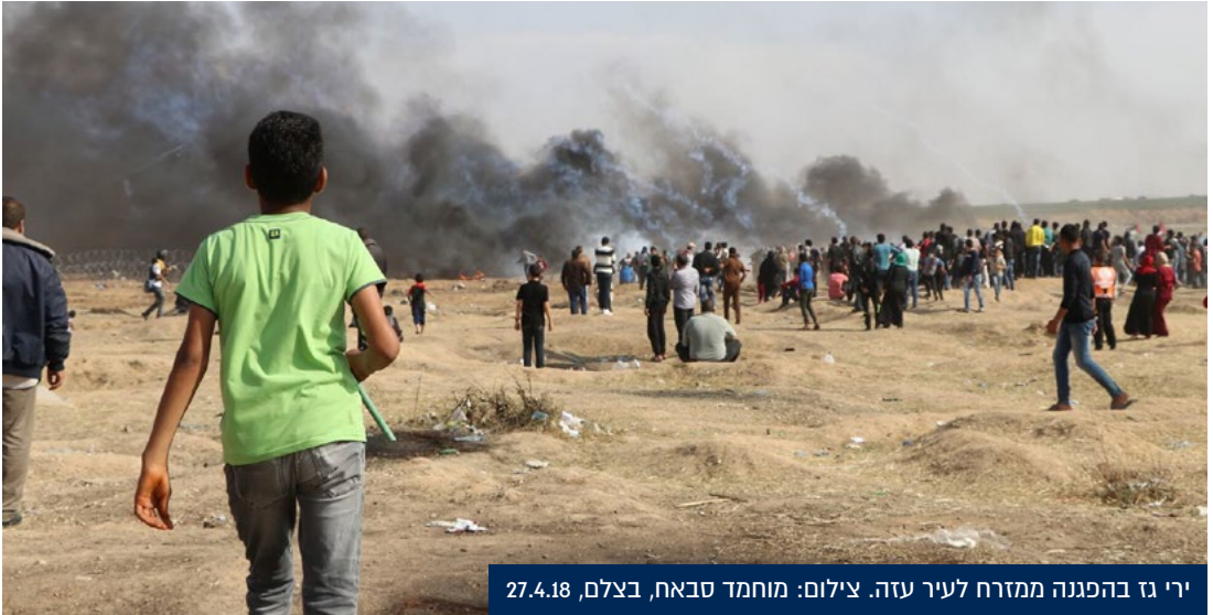
ירי גז בהפגנה ממזרח לעיר עזה. צילום: מוחמד סבאח, בצלם, 27.4.18