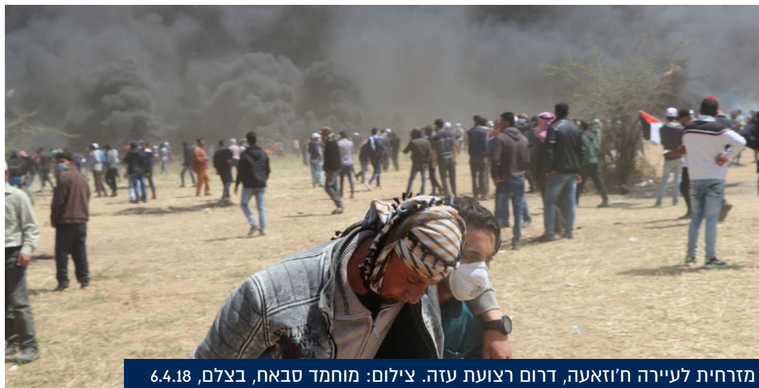
מזרחית לעיירה ח'זאעה, דרום רצועת עזה. צילום: מוחמד סבאח, בצלם, 6.4.18

מתוכם מתחת גיל 18, וכ-8,000 נפצעו. 73 מההרוגים נפגעו בהפגנות שנערכו ב-14.5.18 בתגובה להעברת השגרירות האמריקאית לירושלים. 9